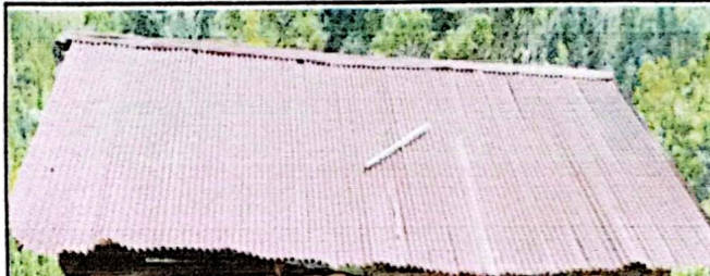
Foto 2: Se observa las condiciones deterioradas en las que se encuentran las láminas del establecimiento.