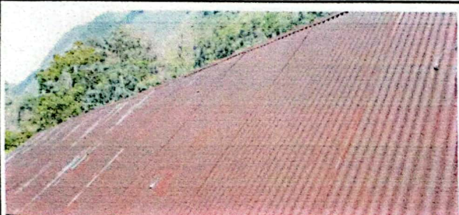
Foto 1: Se observa la estructura deteriorada que sostiene el techo.